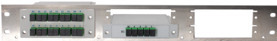
Etulevy 19" ja PLC moduulit 1:16 ja 1:4