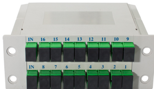
Täyskorkea PLC 1:16 moduuli SC/APC