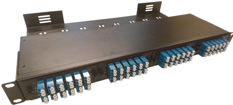
19" MPO 4 moduulin paneeli