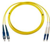
Duplex FC –FC MM

Tietoliikenneverkot, LAN, CCTV, CATV, konesalit ja erilaiset dataratkaisut.