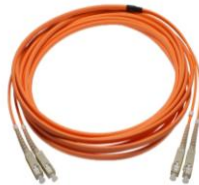
Duplex SC-ST MM